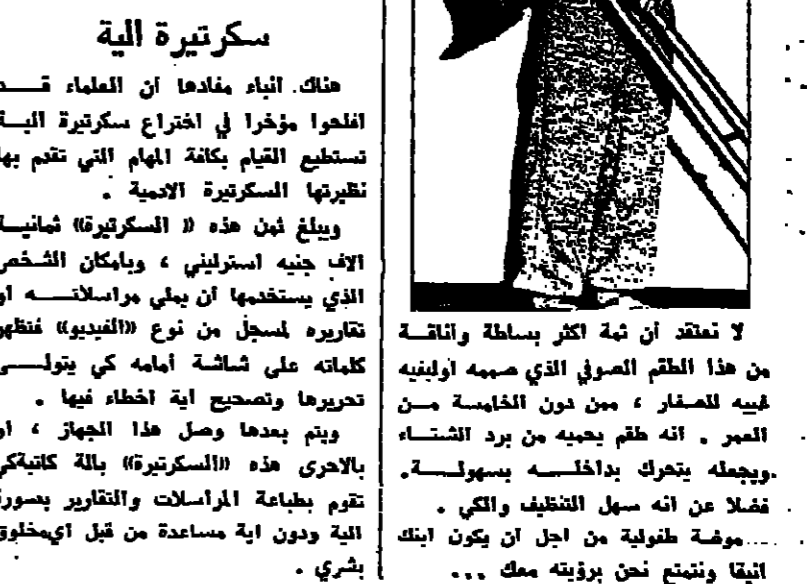
لا تعتقد ان ثمة اكثر بساطة واتانة من هذا الطقم الصوفي الذي صممه اولينيه فيه للصارف - من دون الخامسة من العمر - انه طقم يصيبه من برد الشتاء . ويجهله يتحرك بداخله بسهولة . فضلا عن انه سهل التنظيف والكي . موضة طفولية من اجل ان يكون ابنتك اتيقا ونمتع نحن برؤية موك ..

هناك ابناء مفلاذ ان العلماء قد انلحوا مؤخرا في اختراع مكتنرة الية تستطيع القيام بكافة المهام التي تقوم بها نظيرتها المكتنرة الاحيية . ويبلغ ثمن هذه «المكتنرة» ثمانية آلاف جنيه استرليني ، ويمكن الشخص الذي يستخدمها ان يني مراسلاته و تقريره لسجل من نوع «الفيديو» فظهر كلامه على شاشة امامه كي يتولى تحريرها وتصحيح اية اخطاء فيها . بالاحرى هذه «المكتنرة» بالله كاتيتي تقوم بطباعة المراسلات والتقارير بصورة الية ودون اية مساعدة من قبل اي مخلوق بشري .